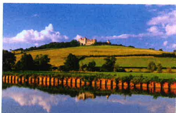
Accès : Pouilly-en-Auxois est situé à la sortie de l'autoroute A6 30 kms de Dijon par l'A38 - 22 min de Beaune.

Découvrez le Canal de Bourgogne tout proche en embarquant sur le bateau promenade ou pratiquez la randonnée sur les chemins de halage.